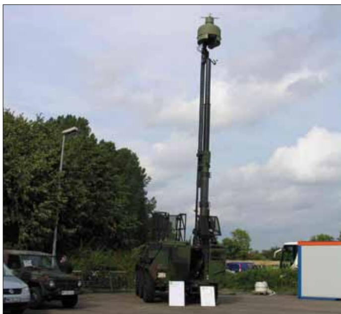
Рис.5. Станция пассивной радиотехнической разведки KWS-RMB

В числе мобильных средств, которые обязательно должны привлекаться к контролю надводного пространства акватории гавани, специалисты Бундесвера предлагают РЛС контрбатареи борьбы COBRA компании EADS Defence & Security (рис.3), способную определять позиции минометов и самодельных ракетных установок террористических групп, обстреливающих гавани. Кроме того, определенные надежды возлагаются на возможность радиоперехвата и пассивной радиотехнической разведки угрожающих целей с помощью станции KWS-RMB (рис.4). Она обеспечивает обнаружение сигналов в диапазоне частот от 0,1 до 40 ГГц. Для более точного измерения координат целей предусмотрена централизованная обработка данных от четырех-пяти таких станций, объединенных в сеть.