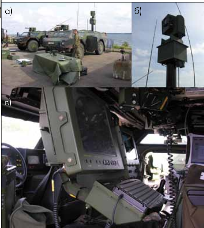
Рис.6. Машина Бундесвера Fenpek: а – общий вид, б – оптический визир, в – внутренний интерьер

Кроме задач, присущих традиционным средствам обнаружения целей в соответствующих физических средах, на автономные подводные аппараты возлагается, например, точная оперативная картография дна гавани и ее маршрутов доступа с помощью бортовых сонаров. Это необходимо для быстрого