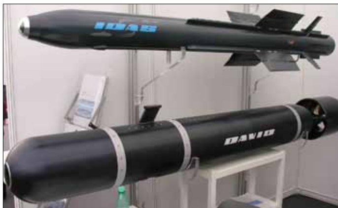
Рис.8. Беспилотный подводный аппарат DAVID компания Diehl BGT Defence

Фирма BAЕ System продемонстрировала на TechDemo 08 аналогичный по форме одноразовый подводный аппарат для