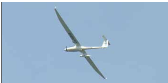
Рис.7. Самолет системы Condor компании OHB-System

обнаружения любого изменения в подводном пространстве, вызванного деятельностью террористов. Иначе необходимо длительное и кропотливое исследование для распознавания и классификации любых потенциальных вторжений, что оставит деятельность в гавани на многие дни.