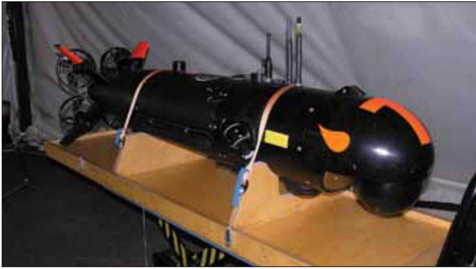
Рис. 10. Беспилотный подводный аппарат SeaWolf A фирмы ATLAS Elektronik

кой эволюции – аппарат SeaFox-IQ компании ATLAS Elektronik, автономный вариант известного противоминного средства, оснащенный сонаром бокового обзора и видеокамерой. При необходимости он может использоваться и как ROV с волоконно-оптическим кабелем передачи данных и команд управления в режиме реального времени при идентификации целей.