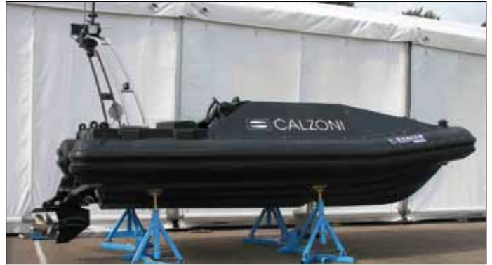
Рис.13. Беспилотный надводный аппарат компании Calzoni

Для контроля акваторий гаваней широко применяются и беспилотные летательные аппараты, однако об этом – следующая часть нашего обзора.