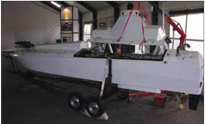
Рис. 12. Беспилотный надводный аппарат SEEWIESEL компании Veers Elektronik & Meerestechnik

В дополнение или как альтернативу акустическим каналам подводной передачи данных с UUV фирма из Великобритании WFS ( www.wirelessfibre.co.uk ) предлагает низкочастотные средства подводной радиосвязи – подводные радиомодемы S5510 и S1510. На расстоянии до 10 м при работе на рамочную магнитную антенну в диапазоне частот 100 – 200 кГц S5510 обеспечивает скорость передачи до 100 кбит/с при потребляемой мощности передатчика 16 Вт. Таким образом, возможно формировать радиоканал, в котором передатчик находится под водой, а приемник – на берегу. Для увеличения дальности действия подводные радиомодемы S1510 и S5510 могут использовать эффект распространения сигналов в грунте. Подобным способом модем S1510 (несущая – единицы килоггерц) может обеспечивать скорость передачи данных 100 бит/с на расстоянии до 1 км. Низкая частота несущей сигналов позволяет реализовать с помощью S1510 связь сквозь ледовое покрытие водоема.