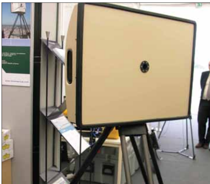
Рис.2. РЛС SEAKER компании THALES

Другое семейство радаров от THALES – BOR-A500 (A550/A560) (рис.2), – оснащено более мощными передатчиками (40 или 80 Вт) и работает в импульсно-доплеровском режиме.