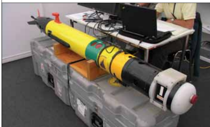
Рис.9. Беспилотный подводный аппарат REMUS-100

Малоразмерные подводные аппараты REMUS-100, -600, -1500, -3000 и -6000 (цифра в названии соответствует максимально допустимой глубине погружения в метрах) разработки американского Океанографического института в Вудс-Хоул (серийное производство компании Hydroid) уже неоднократно демонстрировали свою эффективность при контроле подводной поверхности корпусов судов на предмет наличия взрывных устройств. REMUS-100 (рис.8) оснащен температурным сенсором, датчиком глубины и измерения скорости подводных течений, а также двухчастотным сонаром (900/1800 кГц), способным формировать трехмерное изображение, позволяющее обнаруживать нештатные выступы на поверхности корпуса высотой от 6 см.