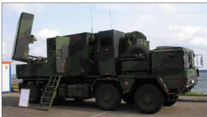
Рис.4. РЛС контрбатареи борьбы COBRA компания EADS Defence & Security