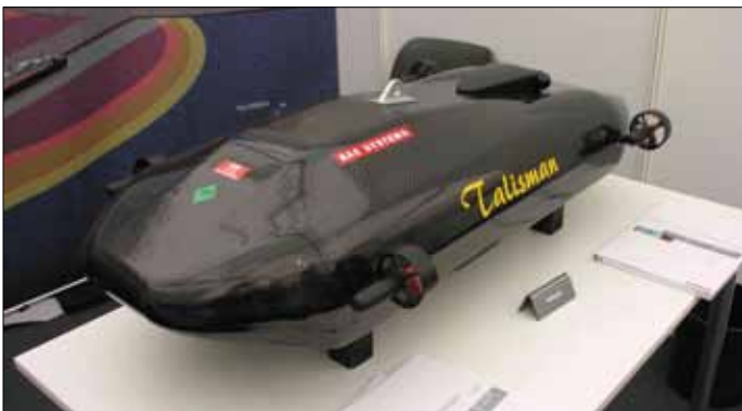
Рис. 11. Подводный робот TALISMAN фирмы BAE System

В целом, одноразовые аппараты, которые развились в разные инспекционные варианты многоразового использования, отличаются от своего торпедного прототипа отсутствием боевой части и наличием многоразового двигателя. Для обеспечения широкополосной связи с UUV ряд фирм предлагают применять плавучие радиобакины, которые держат связь с аппаратом с помощью подводного акустического канала передачи данных. Наличие в бакене приемника GPS обеспечивает точное определение местоположения и поэтому потенциально позволяет использовать UUV с сонаром для картографии грунта или осмотра и обслуживания трубопроводов, нефтегазовых терминалов и т.п. Опыт, накопленный на протяжении многих испытаний, четко показал, что контроль поверхности больших, но простых по форме объектов, подобных большинству торговых судов, сравнительно прост. Типичная скорость инспекции поверхности корпуса судна такого типа для поиска взрывных устройств может составлять 200 м 2 /мин. В то же время, более сложные по профилю объекты, подобные катамаранам, нефтяным терминалам или военным кораблям, создают трудность в мониторинге.