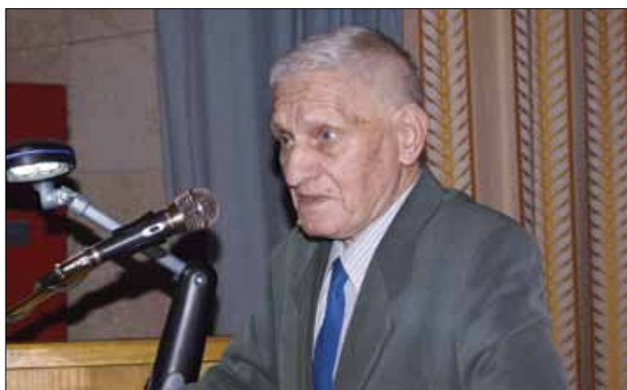
Создатель первых кремниевых планарных транзисторов — Ф.А. Шиголь

широкого спектра поисковых научно-исследовательских работ, число которых существенно сократилось в последние два десятилетия. На это государственные деятели и Министерство должны обратить внимание.