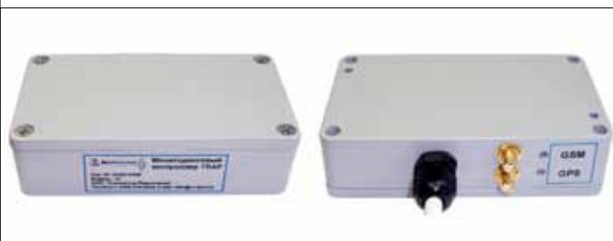
Рис. 1. Контроллер TRAP-1S

Открытая архитектура контроллера позволяет создавать на его базе дополнительные подсистемы, расширяющие возможности систем мониторинга и увеличивающие эффект от их внедрения. К ним относятся, например, подсистема учета рабочего времени водителя, подсистема контроля передвижения контейнеров, подсистема контроля температурного режима в рефрижераторах, подсистема контроля уровня топлива в цистернах.