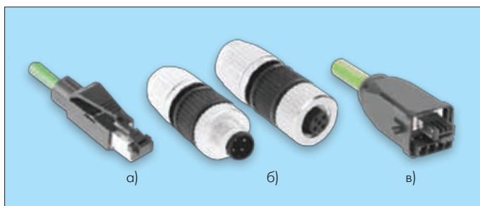
Рис.2. Соединители PROFINet: а) RJ45; б) M12; в) гибридный соединитель

Соединители, которые используют вне стива, соответствуют классу безопасности IP65 или IP67. Для тех же, что применяются внутри, достаточно и IP20. Приборы, встраиваемые только в стив, снабжают гнездами RJ45. Снаружи применяют совместимые с RJ45 соединители с уровнем безопасности IP67, описанные в стандарте IEC 61076 Part 3-106: