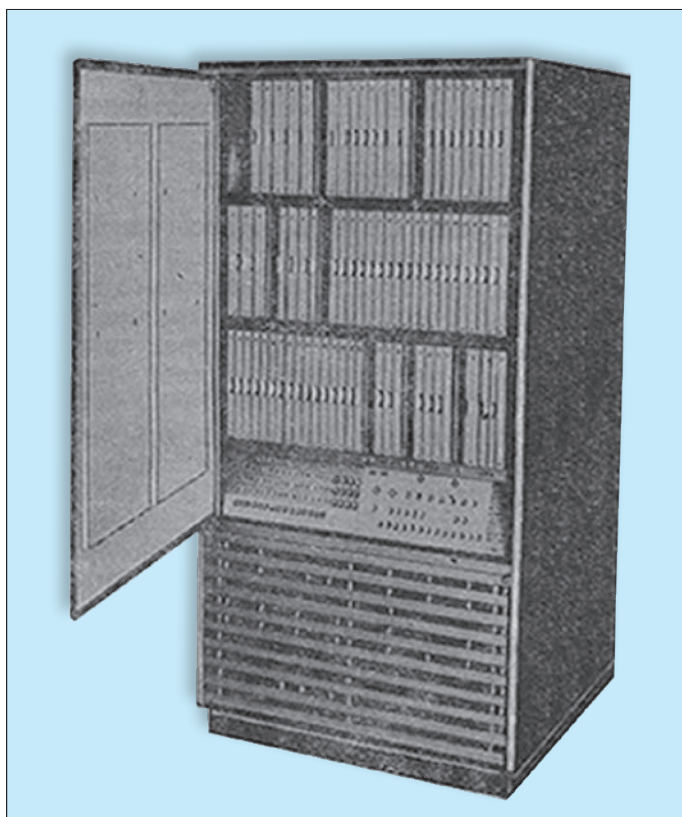
Рис.2 . ЭВМ УМ-1НХМ