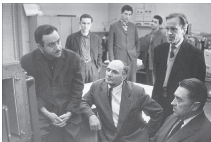
Рис.3 . Апрель 1962 года. В СКБ-2. Раздумья о том, как встретить Н.Хрущева

главной задачей – создание и отработка в опытном производстве новых технологий, новых продуктов для последующей передачи их на серийные заводы. И главным продуктом для него была товарная ИС. Такой подход вписывался и в совнархозовскую, и в министерскую структуры. Причем он позволял унифицировать как сами ИС, так и все необходимое для их создания. Тем самым затраты на формирование и развитие микроэлектроники уменьшались в разы. С таким подходом страна справиться могла – и справилась.