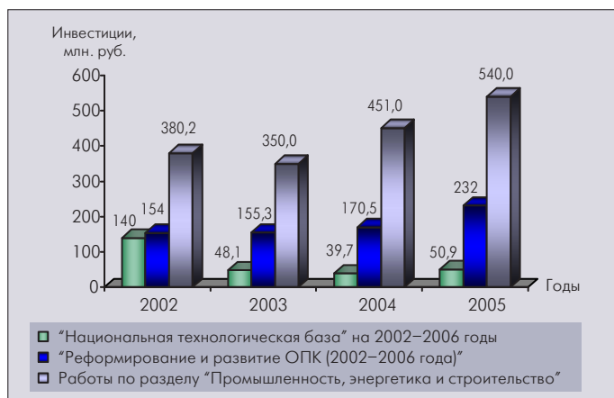
Рис. 2. Инвестиционная деятельность предприятий РЭК в 2002–2005 годы (по источникам финансирования)

Большая часть инвестиций (рис.2) в 2005–2006 годах направляется на импортозамещение изделий микроэлектроники, СВЧ-электроники, пьезотехники, радиокомпонентов, спецматериалов и развитие современной ЭКБ для ликвидации отставания в этой области от мирового уровня. Капитальные вложения предназначены в первую очередь для создания производств по выпуску мощных видов радиоэлектронных вооружений, зенитных ракетных комплексов, систем РЭР и РЭБ и др., а также нового поколения мощных кремниевых СВЧ-транзисторов и модулей.