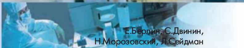
Е.Берлин, С.Двинин, Н.Морозовский, Л.Сейдман

ская рабочая камера (рис. 1). Система вакуумной откачки этой камеры – безмасляная. Откачка до рабочего вакуума и в процессе обработки производится химически стойким турбомолекулярным насосом типа Turbo-V 551 Navigator или аналогичным агрегатом. К нижнему фланцу камеры крепятся патрубок с датчиками вакуума и патрубок с управляемой дроссельной заслонкой и высоковакуумным затвором. Форвакуумная откачка рабочей камеры и камеры шлюза осуществляется агрегатами типа спиральный насос фирмы Anest Iwata.