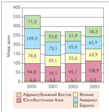
Рис.1. Динамика и региональная структура мирового рынка электронных компонентов