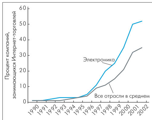
Рис. 1. Интернет в качестве инструмента торговли

В отличие от B2C, площадки типа B2B строятся по принципу двустороннего обмена между поставщиками и клиентами. Здесь в роли покупателя выступают независимые дистрибьюторы или крупные производители электронных систем, закупающие большой объем компонентов. B2B-площадка позволяет покупателю получать предложения по запрашиваемому компоненту от множества компаний всего мира. По данным e-BW, 94% поставщиков, занимающихся онлайн-торговлей электронными компонентами, используют Интернет-сайт своей компании в качестве канала продаж, а 65% выставляют свои предложения на B2B-площадках.