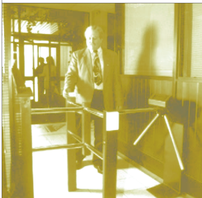
Рис. 4. В проходной

Специальное оборудование и программное обеспечение позволяют легко оформлять пропуска в виде proximity-карточек непосредственно в бюро пропусков объектов. В этом случае на карточку наносятся фотография, название организации и необходимая информация о владельце (ФИО, должность и др.). Сейчас существует два основных способа оформления карточек – цветная печать на карточке с помощью сублимационного принтера и специальные “паучи”. В “пауч” вкладывается фотография и информация о владельце, за-