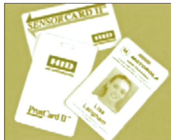
Рис. 3. Proximity-карты

Особенно эффективна proximity-технология при организации контроля въезда и выезда. Водителю при въезде на объект не нужно подъезжать вплотную к считывателю или тем более выходить из машины, что необходимо делать при использовании