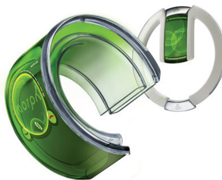
Рис.1. Гибкая сенсорная панель для мобильных телефонов

Интерес к "бумажной" печатной электронике большой. По оценкам доктора Питера Харропа, председателя правления компании IDTechEx, через 20 лет, когда рынок печатной электроники