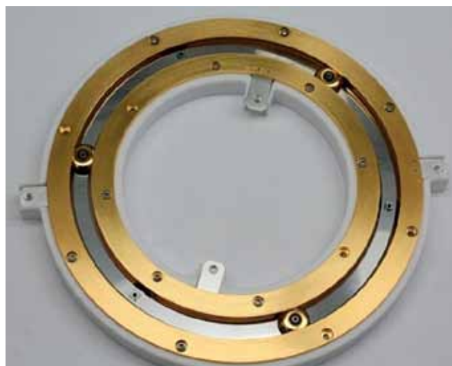
Рис.2. Часть конструкции вращающегося перехода Roll-Rings с контактными элементами couplers между внутренним и внешним кольцами

специальных гибких колец, которые свободно вращаются в проточенных канавках между ротором и статором перехода. Гибкие позолоченные кольца имеют цилиндрическую форму и тонкие стенки. Для обеспечения контакта требуется незначительное усилие, это уменьшает трение, гарантирует высокую проводимость, и, соответственно, минимальные потери в переходе, а также отсутствие искрения и высокую надежность.