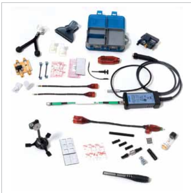
Рис.1. Пробник D2505 с аксессуарами

Узел "платформа/кабель" предлагается в трех вариантах для подключения к различным устройствам: входным разъемам ProLink (доступны с 2002 года в серии осциллографов WaveMaster производства компании LeCroy и сегодня используются во всех осциллографах LeCroy с полосой пропускания более 4 ГГц), входным разъемам 2,92 мм (используются в осциллографах серии WaveMaster 8Zi-A с полосой пропускания 20–45 ГГц) и входным разъемам ProBus. Узел "платформа/кабель" выполняет три важные функции: обеспечивает подачу питания на усилитель пробника от осциллографа; передает на осциллограф сообщения, по которым проводится идентификация характеристик используемого в пробнике усилителя и для соответствующего канала осциллографа автоматически устанавливается необходимое значение ослабления; производит согласование нагрузки пробника.