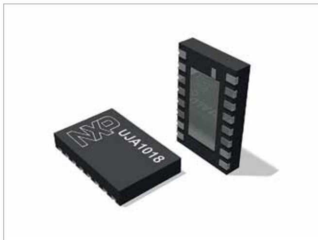
Рис.1. Датчик светодиодной подсветки

Модуль UJA1018 предназначен для сетей LIN (Local Interconnect Networks) и является первым