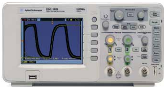
Рис.1. Осциллограф серии 1000V

Мощный захват и отображение сигналов. Все модели серии 1000V оснащены ярким LCD-дисплеем с четким изображением и широким углом обзора. Глубина памяти новых осциллографов составляет до 16 Квыб. на канал, что в шесть раз больше, чем глубина памяти других осциллографов этого класса. Кроме того, частота дискретизации 1 Гвыб./с обеспечивает исключительную детализацию сигналов.