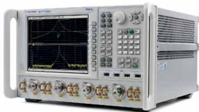
Рис.3. Векторный анализатор цепей PNA-L

И улучшенный характернограф B1505A, и новый B1505AP отлично подходят для разработчиков и изготовителей силовых полупроводниковых