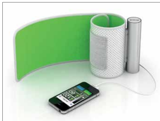
Рис.2. Подключаемая к смартфону манжета для измерения кровяного давления

Сегодня высоким темпам развития рынка МЭМС препятствуют длительные циклы НИОКР и отсутствие стандартных процессов производства. Так, Виджей Уллал (компания Maxim) считает, что в области МЭМС ежегодно следует проводить до 15 НИОКР (сейчас четыре-пять). Но это потребует недоступного для отдельной компании уровня финансирования. Следует помнить, что объем рынка в сильной степени зависит от цены представленных на нем продуктов. Увеличение через несколько лет объема продаж до 10^{12} МЭМС-датчиков станет возможным, если они будут стоить не 10 долл., как сегодня, и даже не 1 долл., а лишь несколько центов. На рынке уже есть 12-разрядные акселерометры стоимостью менее 0,35 долл. и микрофоны по цене 0,25 долл. Но даже при стоимости МЭМС-датчиков в несколько центов объем продаж 10^{12} датчиков останется в пределах 10 млрд. долл. Генеральный исполнительный директор компании Kionix Грегори Гальвин обосновал свои сомнения относительно достижения объема продаж МЭМС в 1 трлн. долл. тем, что на долю МЭМС-датчиков приходится всего 2% стоимости конечных изделий на их основе. И если рынок в 1 трлн. МЭМС-устройств состоится, объем продаж