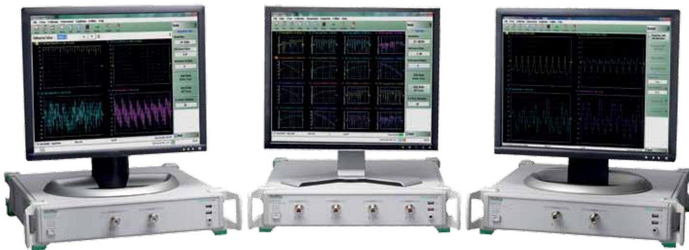
Рис.2. Различные модели ShockLine с единым графическим интерфейсом пользователя

предлагается в двух вариантах – двухпортовом, и четырехпортовом.