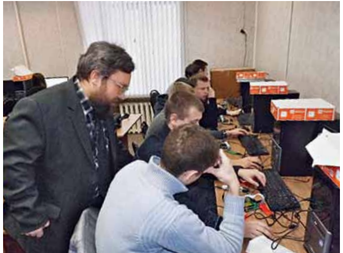
Рис.3. Учебный класс в Рязанском государственном радиотехническом университете (РГРТУ)

значительно уменьшается количество микросхем в конечном изделии, сокращаются сроки реализации проектов, при этом расширяется функционал аппаратуры. Данный подход позволяет повысить надежность, уменьшить габариты и вес проектируемого модуля, снизив его стоимость.