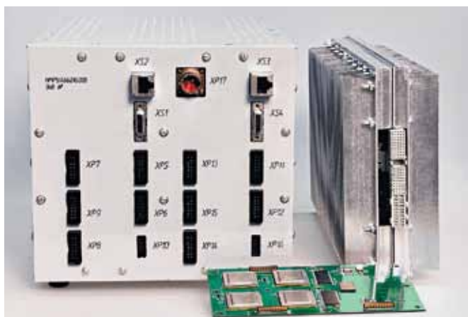
Рис.2. Выходной продукт: высокоскоростной многокластерный интегрированный модуль обработки данных

В настоящее время Центр проектирования РЭА компании "ПКК Миландр" также проводит работы в области создания унифицированных модулей (микросборок) для автоматизированных систем управления в сфере ОПК и промышленной автоматизации (рис.1). Микросборки применяются для замены импортной компонентной базы или устаревшей элементной базы отечественного производства. Встраивание микросборок в корпус выполняется по двум технологиям: Wire Bond (разварка проводниками) или Flip Chip (поверхностный монтаж). В качестве подложек для микросборок используются высокотемпературная или низкотемпературная керамика либо многослойные печатные платы. Благодаря применению микросборок