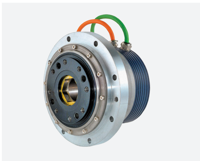
Рис.2. Сервопривод с волновым редуктором с полым валом серии FHA-C

В качестве датчиков положения на валу двигателя для сервоприводов серии LynxDrive доступны абсолютные