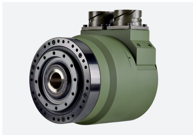
Рис.3. Сервопривод для жестких условий эксплуатации AlopexDrive

Габариты сервоприводов серии FPA от 11 (3,9 Нм) до 32 (300 Нм). Кратковременный и длительный момент на выходе сервоприводов этой серии, как правило, ниже, чем у изделий серии США на 10–45%. На вал двигателя могут быть установлены датчики положения нескольких видов – инкрементальные и абсолютные энкодеры или резольвер. Все двигатели в серии