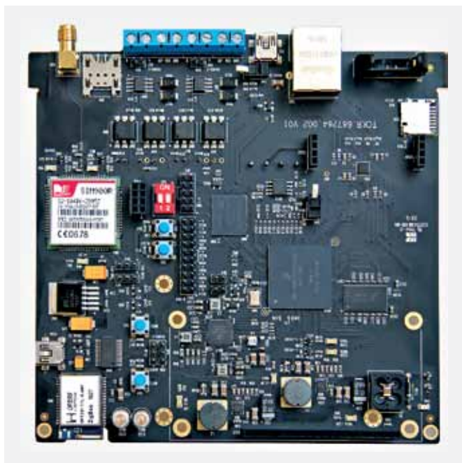
Рис.2. Собранная плата УСПД

и составление списка приборов учета, настраиваются временные интервалы считывания данных и журнала событий, проверяется состояние устройства и обновляется программное обеспечение. При отсутствии подключения к глобальной сети все операции по обмену информацией с центральным сер-