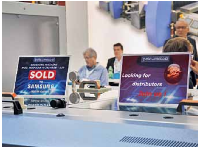
Установка для подготовки поверхностей печатной платы компании Pola & Massa, модель Modular 4/25/FASB-120