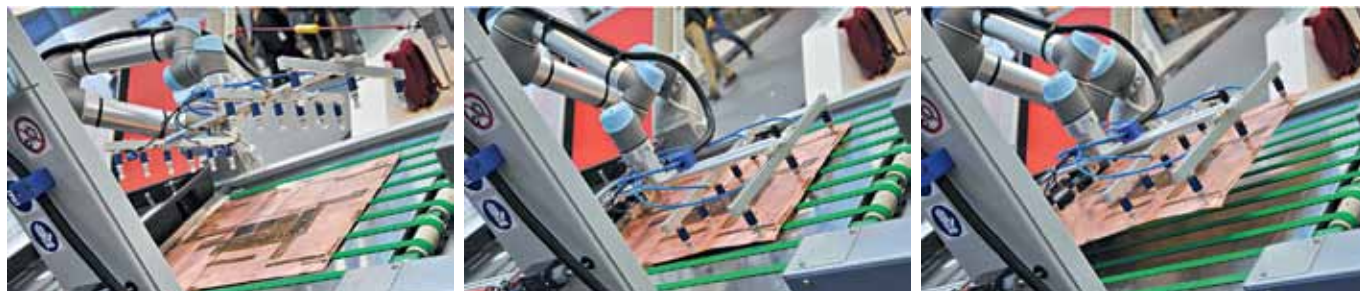
Фрагменты рабочего процесса автомата PeM Heron