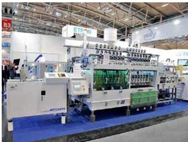
Прецизионная линия вакуумного щелочного травления фирмы Universal P.C.B. Equipment

Надо сказать, в то время иммерсионное олово было инновационной технологией не только в России, но и во всем мире. Теперь, по опыту его двадцатилетней