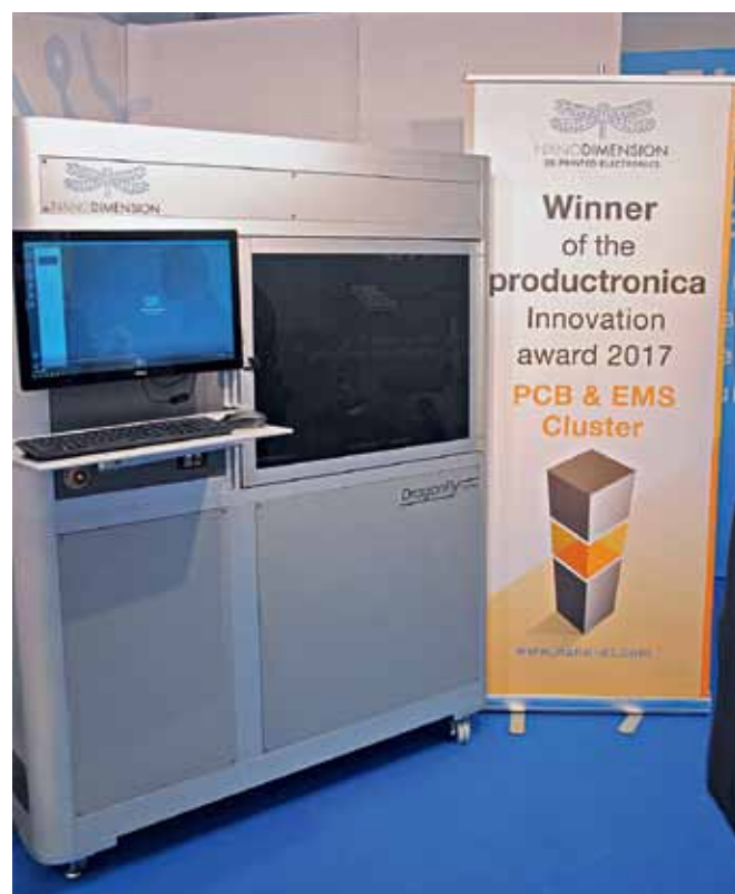
3D-принтер DragonFly 2020 Pro