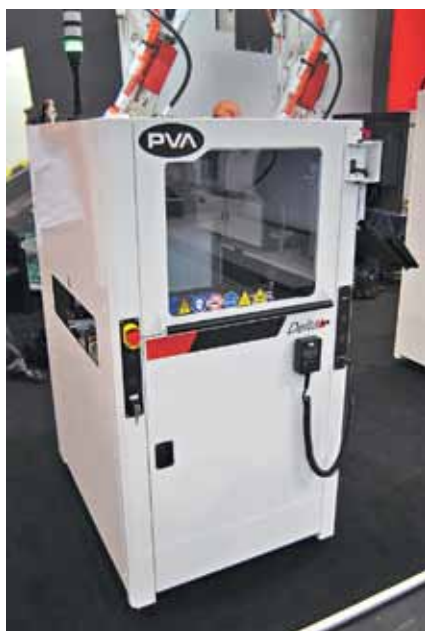
Установка селективного нанесения покрытий Delta 6

Еще одно активно развивающееся направление – Optical bonding, или, другими словами, соединение