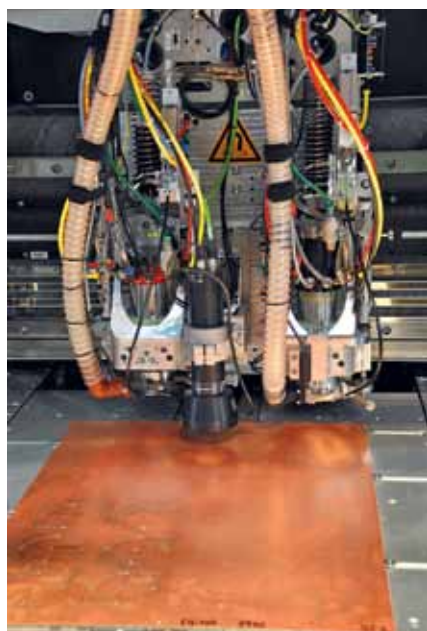
Одна из станций сверлильно-фрезерного станка UltraSpeed TRIO, комплектация COMBI

Станок для производств меньшей серийности – UltraSpeed MONO. Представленная модель имеет два шпинделя, в данном случае оба они сверлильные. Если работа идет с мультиплицированной заготовкой, и каждая плата в ней имеет размер более 150 мм, то шпиндели расходятся на шаг мультипликации и работают синхронно, увеличивая производительность в два раза по