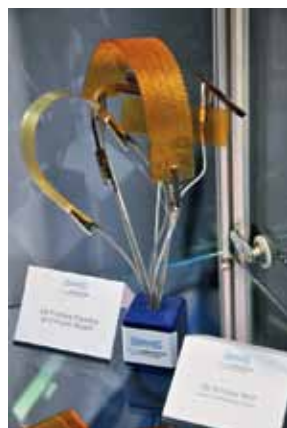
Платы, изготовленные на принтере DragonFly 2020

В качестве еще одного массового потребителя установки мы видим университеты. DragonFly 2020 будет полезен при обучении студентов-схемотехников, а также войдет в состав оснащения научных центров при учебных заведениях. В таких организациях, как правило, не устраиваются очистные сооружения, специальная канализация – неперенный атрибут