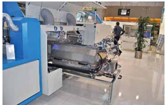
К агрегатам системы пайки волной SEHO MaxiWave 2340 C также обеспечен удобный доступ для обслуживания

Экономия азота обеспечивается благодаря программному контролю и регулированию его потребления в зависимости от выполняемой программы обработки. Кроме того, обычно при падении давления азота в линии возникает ошибка, требующая вмешательства оператора. Благодаря программному управлению давлением наша система в ряде случаев способна