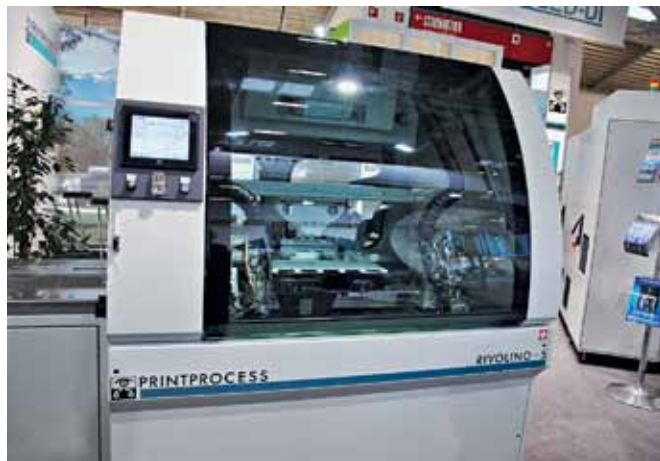
Установка для сборки пакета гибко-жестких МПП перед прессованием Rivolino 5

Отличительная особенность машин Apollo – модульность построения. Это тоже уникальное качество – никто, кроме Printprocess, не делает модульных машин аналогичного назначения. Вариант, представленный