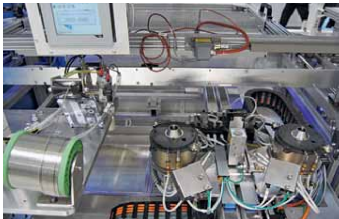
Внутреннее пространство модуля пайки с двумя головками системы SEHO SelectLine

Также особенность наших модулей пайки – применение электромагнитных насосов вместо традиционных механических крыльчаток. Это увеличивает ресурс оборудования благодаря отсутствию вращающихся частей, а также обеспечивает равномерную высоту волны. Кроме того, в таком решении отсутствует турбулентность, что приводит к уменьшению образования шлака и сокращает необходимый объем обслуживания ванн.