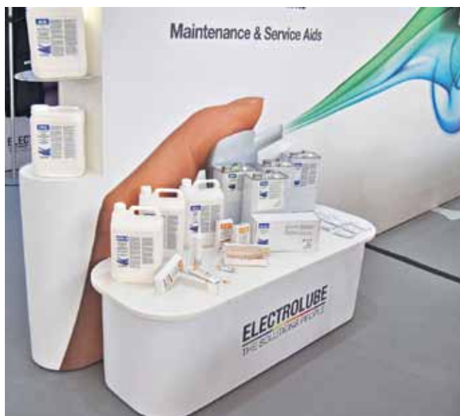
Защитные покрытия и материалы для обеспечения теплового режима на стенде компании Electrolube

он достаточно мягкий, чтобы хорошо работать в условиях термоударов. Материал 2K550 сравнительно близок по свойствам к покрытию 2K500, но помимо этого является самозатухающим. Все материалы линейки 2K