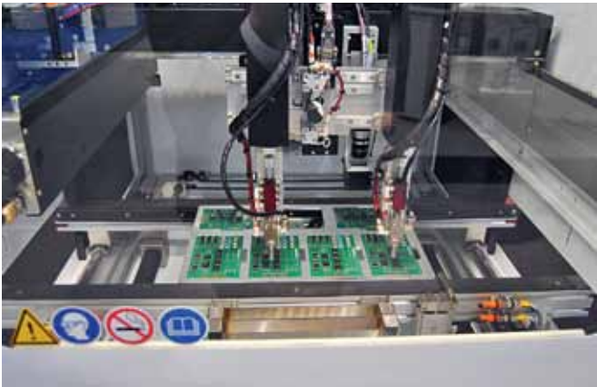
Внутреннее пространство установки селективного нанесения покрытий Delta 8 с двумя клапанами

различных изделий с помощью оптически прозрачных адгезивов. Вероятно, в ближайшее время этот рынок в глобальном масштабе станет для нас вторым по объему. Это направление действительно ставит новые задачи перед отраслью, и мы вкладываем большие ресурсы в соответствующие разработки, чтобы отвечать этим вызовам. На этой выставке мы представляем систему Delta Bond, которая способна наносить адгезив заливкой, устанавливать приклеиваемое защитное стекло, контролировать растекание адгезива с помощью системы Fluid-Flow Vision и выполнять полное отверждение адгезива в одной установке.