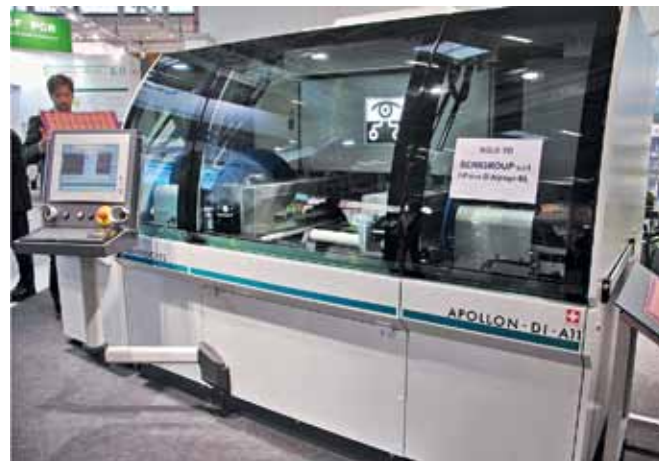
Установка прямого экспонирования Apollo-DI-A11