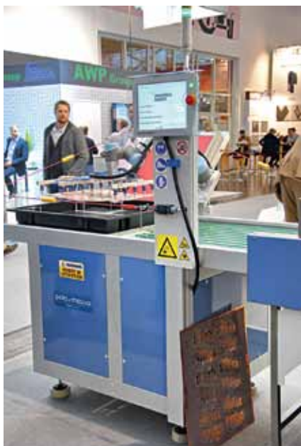
Универсальный роботизированный загрузчик/разгрузчик семейства PeM Heron

аналогичного оборудования. Так, на ее стенде представлен универсальный робот для загрузки/разгрузки технологических установок. Обратите внимание – его рабочая зона открыта. Обычно у такого рода установок она заключается в кожух, чтобы машина отвечала требованиям стандартов по безопасности, принятых в Европе и многих других странах. Робот же фирмы Pola & Massa имеет активную систему безопасности, которая при прикосновении к рабочим органам блокирует их движение, и защитный кожух ему не нужен.