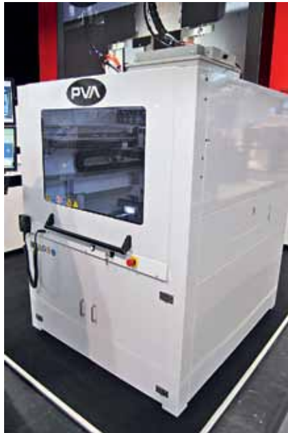
Установка Delta Bond компании PVA для работы по технологии Optical bonding – приклеивания на дисплеи защитного стекла специальными оптически прозрачными адгезивами

различных изделий с помощью оптически прозрачных адгезивов. Вероятно, в ближайшее время этот рынок в глобальном масштабе станет для нас вторым по объему. Это направление действительно ставит новые задачи перед отраслью, и мы вкладываем большие ресурсы в соответствующие разработки, чтобы отвечать этим вызовам. На этой выставке мы представляем систему Delta Bond, которая способна наносить адгезив заливкой, устанавливать приклеиваемое защитное стекло, контролировать растекание адгезива с помощью системы Fluid-Flow Vision и выполнять полное отверждение адгезива в одной установке.