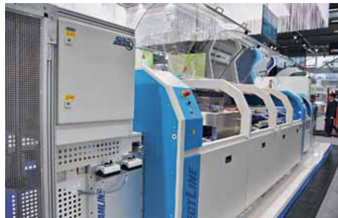
Система манипулирования SEHO StreamLine и модульная система селективной пайки SEHO SelectLine на стенде компании SEHO Systems GmbH