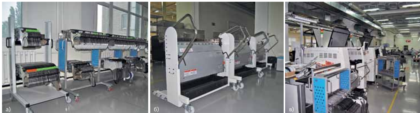
Смена питателей в старых и новых автоматах Samsung: а – подкатные тележки для SM421 и SM451; б – сменные базы питателей для SM471 Plus и SM481 Plus; в – за подкатной тележкой можно видеть сменную базу, подключенную к установщику SM481 Plus

Помимо этого набора оборудования, фактически, обязательного для серьезного контрактного производителя, на участке организована группа рабочих мест