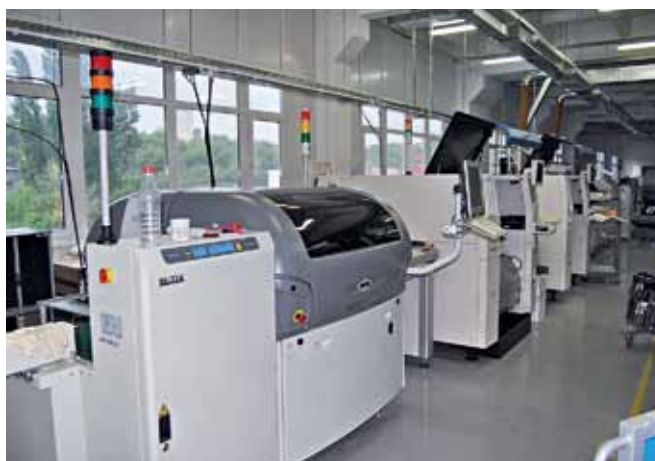
Автоматическая линия поверхностного монтажа с установщиками компании Samsung, работающая с 2006 года

Для своего времени линия была одной из самых передовых в отечественной электронной промышленности, она позволяла совместить высокую гибкость в работе с хорошей – тоже, конечно, для того времени, – скоростью