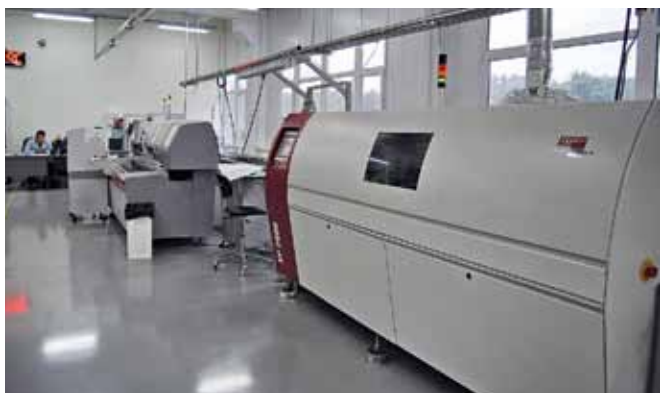
Линия с каплеустройным принтером и установщиком компании MYDATA, вид со стороны печи оплавления

монтажа. Точностных характеристик этой линии и по сей день хватает, чтобы работать со всеми серийными изделиями.