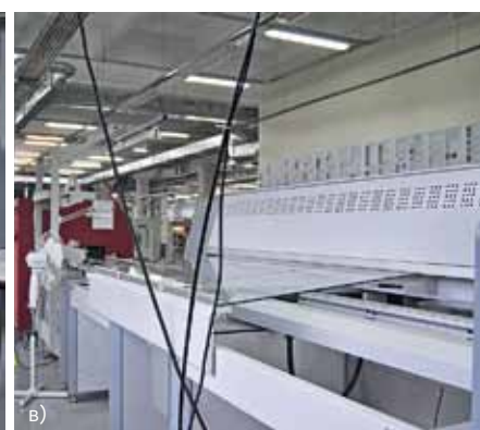
Вторая линия автоматической сборки: а – загрузчик и каплеустройный принтер MY500; б – сборочный автомат MY100DX с боковым загрузчиком из поддонов; в – конвейер с тыльной стороны сборочного автомата