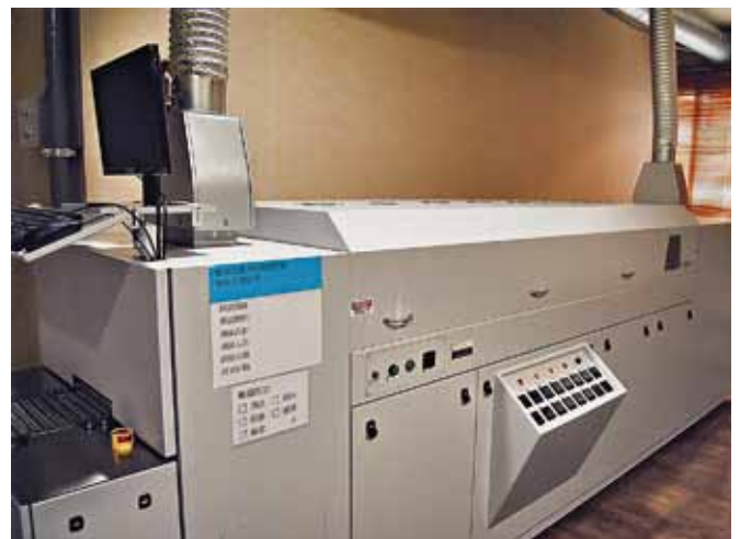
Печь конвекционной пайки оплавлением, используемая для испытания на качество пайки предохранителей для поверхностного монтажа