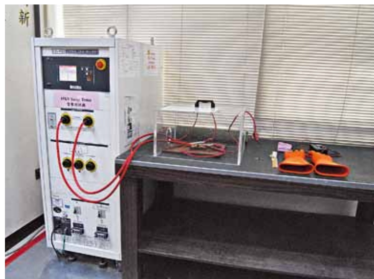
Установка испытаний на импульсное перенапряжение 15 кВ

Как известно, чаще всего электроника выходит из строя при включении или выключении, то есть в условиях переходных процессов. Поэтому предохранители также выборочно испытываются на стойкость к циклам подачи и снятия нагрузки. Обычно в процессе испытаний выполняется по меньшей мере 1000 циклов.