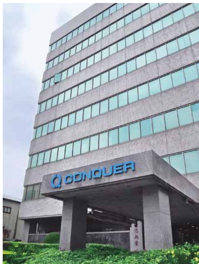
Здание Conquer Electronics в Тайбэе