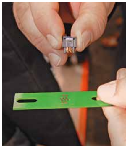
Разъем WR-WST REDFIT IDC SKEDD