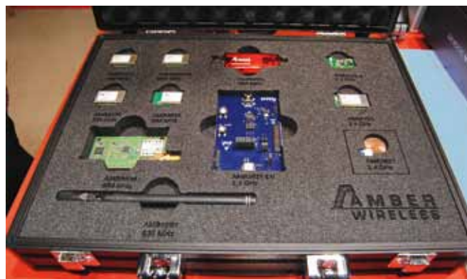
Демонстрационный набор решений для беспроводной связи от компании AMBER wireless

Подразделение Würth Elektronik, занимающееся оптоэлектронными изделиями, также показывает здесь обширный спектр своей продукции, среди которой и новые миниатюрные одноцветные светодиоды для поверхностного монтажа WL-SMCC в корпусах 0402 и 0603, и RGB-светодиоды в корпусе PLCC-6 серии WL-SFTW, и четыре новые серии инфракрасных поверхностно-монтажных светодиодов.