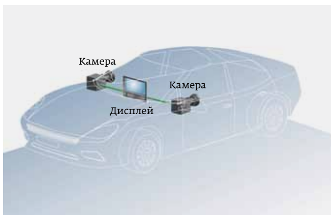
Рис. 5. Конфигурация типа хаба на основе коаксиального физического уровня с использованием FD-связи

Все эти топологии опционально поддерживают передачу питания по коаксиальному каналу данных. Это позволяет отказаться от специальных линий и разъемов питания для каждого узла в сети, сэкономив затраты, снизив вес и упростив процесс сборки автомобиля. Архитектуры, показанные на рис. 5 и 6, – примеры того, насколько удобной может быть передача питания по коаксиальному