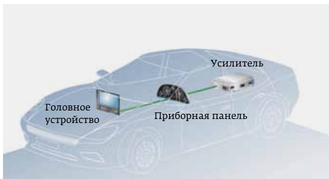
Рис. 4. Информационно-развлекательная система, состоящая из трех узлов, включенных по топологии «цепочка» на основе коаксиального физического уровня с использованием FD-связи

Возможен еще один вариант топологии для трех и более узлов с коаксиальным кабелем и FD-связью – конфигурация типа хаба. На рис. 5 показана сеть, в которой автомобильный дисплей выступает в качестве хаба, подключенного с помощью двухточечных соединений к двум камерам заднего вида, используемым вместо внешних зеркал.