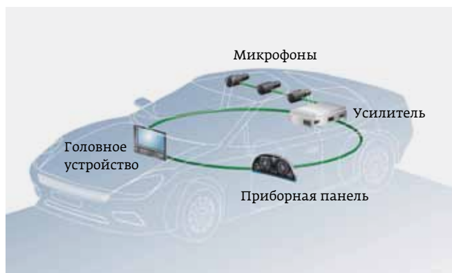
Рис. 6. Расширение существующей информационно-развлекательной системы, построенной на базе топологии «кольцо», дополнительной сетью типа «цепочка»

Понимание суммарных системных затрат необходимо также, чтобы осмыслить конкурентное преимущество,