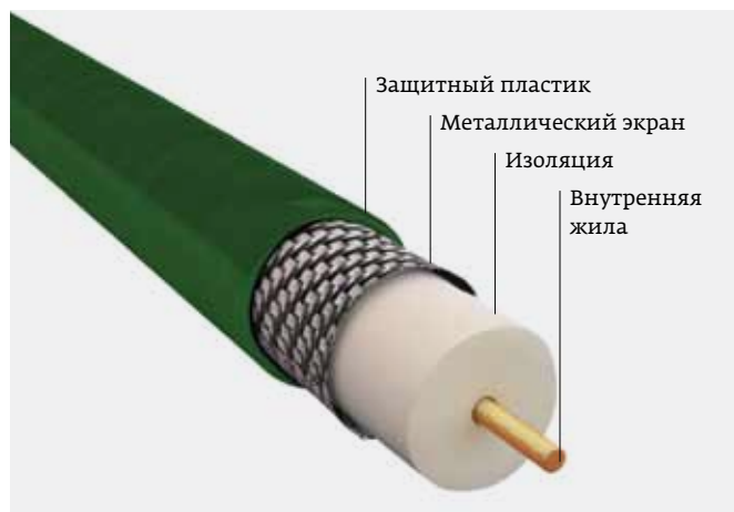
Рис. 1. Поперечное сечение коаксиального кабеля

Использование FD-связи по коаксиальному кабелю позволяет реализовать топологию, которую создать иным способом невозможно. Например, применение ее