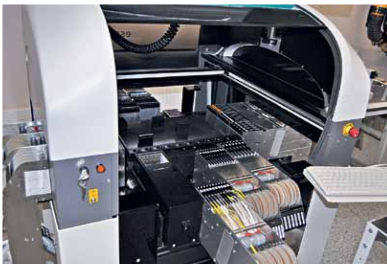
Автомат поверхностного монтажа Essemtec FLX 2011 V