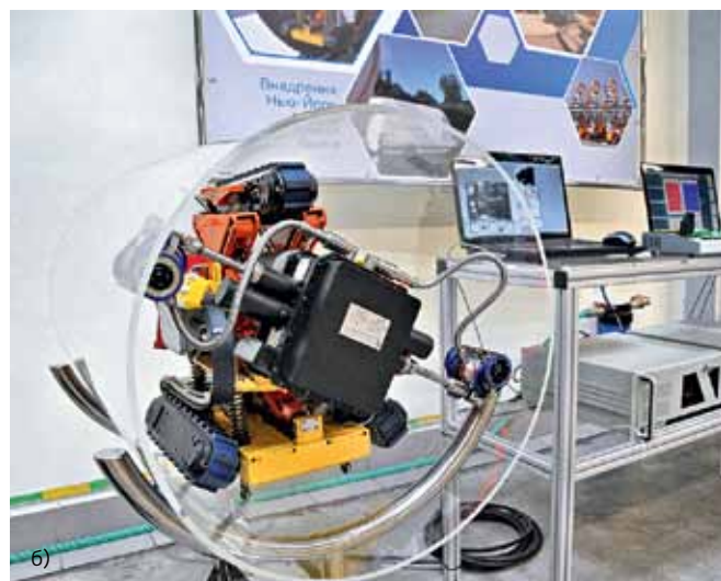
Продукция ГК «Диаконт»: а – электромагнитные приводы различных типов; б – взрывозащищенное средство доставки, оснащенное визуальной камерой измерительного контроля