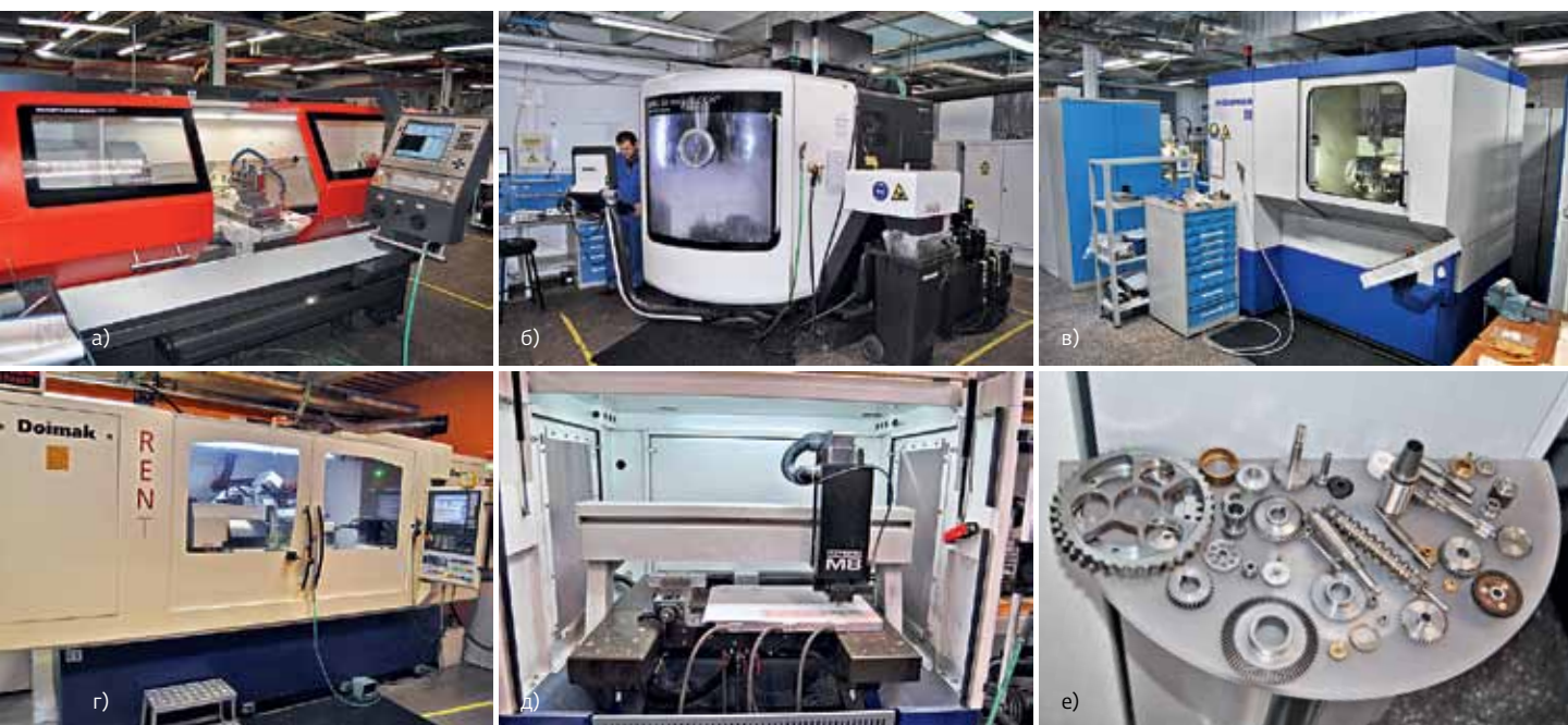
Оборудование для механической металлообработки: а – Masturn 550 CNC1500 – токарный станок для малосерийного производства; б – 5-осевой универсально-фрезерный обрабатывающий центр DMG DMU60 topoBLOCK; в – 8-осевой зубофрезерный станок EMAG КОЕPFER200; г – резьбошлифовальный станок Doimak REN-T; д – рабочая зона Datron M8 – высокоскоростного фрезерного станка для обработки корпусов и профилей из алюминия, других цветных металлов и композитов; е – детали, изготовленные на зуборезных станках КОЕPFER. Слева у стены – спутник планетарно-цевочного редуктора с зубцами особого профиля

Для изготовления деталей такой формы, которую невозможно воспроизвести механическими методами, у нас имеется пять единиц электроэрозионного оборудования. Одна из них – прецизионный электроискровой станок Sodick AG60L. Принцип его действия основан на методе копирования фасонной поверхности электрода на обрабатываемой заготовке; эффект достигается за счет расплавления металла заготовки в момент приближения электроинструмента. Этот метод особенно полезен