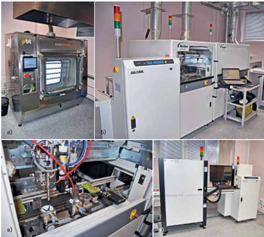
Линия нанесения влагозащитных покрытий: а – система струйной очистки Super Swash; б – система селективного нанесения ВЗП Nordson Asymtek SL-940 и установка ультрафиолетового отверждения Nordson Asymtek UV9. Справа – угловой конвейер к оптической инспекции; в – рабочая зона системы SL-940. Трубки красного цвета – линии подачи материала к аппликатору, которые надо перестыковать при переходе с одного типа покрытий на другой; г – АОИ Viscom S3088 CCI