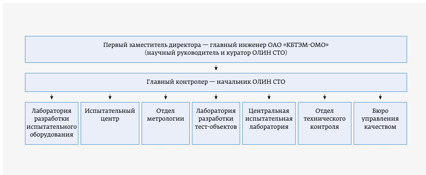
Рис. 1. Организационная структура ОЛИН СТО