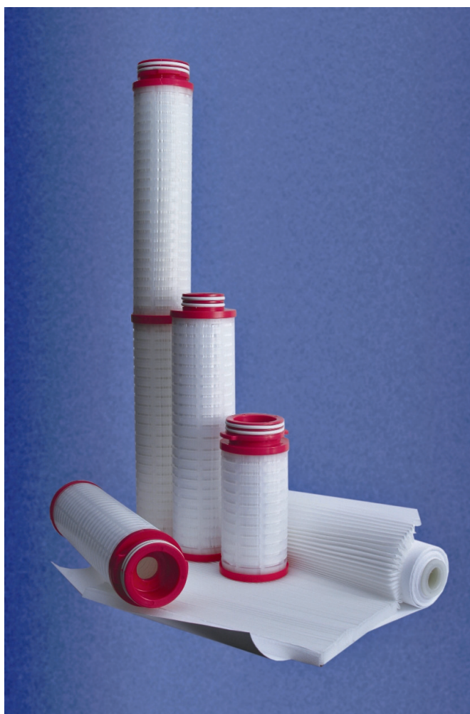
Рис. 4. Гофрированные фильтрующие элементы на основе «ЭКОПЛЕН-F»

В качестве фильтрующего материала для очистки газообразных сред используются фильтроэлементы глубинного типа марки «ЭКОПЛАСТ-F» с рейтингом фильтрации от 0,2 до 20 мкм и гофрированного типа марки «ЭКОПЛЕН-F» с рейтингом фильтрации от 0,2 до 5 мкм. Рабочая температура фильтроэлементов марки «ЭКОПЛАСТ-F» до 160 °С, а для марки «ЭКОПЛЕН-F» – до 135 °С.