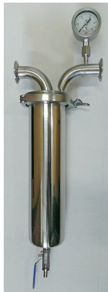
Рис. 6. Фильтродержатель ДФП-201G-250-A7-2

Фильтроэлементы можно регенерировать прямым и обратным током пароводяной смесью, острым паром в линии, стерилизовать в автоклаве, а также применять другие способы очистки и регенерации.