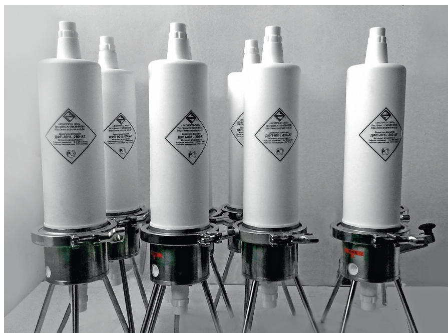
Рис. 7. Фильтродержатели ДФП-001L

Фильтровать химически агрессивные жидкости можно с помощью фильтроэлементов глубинного типа марки «ЭКОПЛАСТ-F». В данном случае речь идет об использовании соответствующих элементов из фторопласта-4 для фильтрации особо агрессивных кислот, щелочей, растворов органических солей, перекиси водорода и пр. Перечень жидкостей достаточно широкий. Применение ПТФЭ марки Ф-4, который отличается уникальной химической стойкостью, может быть ограничено лишь условиями