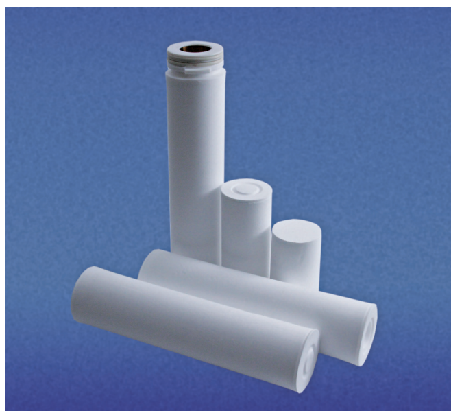
Рис. 1. Фильтрующие элементы на основе «ЭКОПЛАСТ-Ф»

С помощью фильтрующих элементов от ГК «Обнинские фильтры» на предприятиях различных отраслей промышленности обеспечивается фильтрация главным образом химически агрессивных жидких и газообразных сред. Благодаря уникальным свойствам поропластов – высокой химической, механической и термической стойкости – они подходят и для других целей. Высокое качество изготовления поропластов на специальном