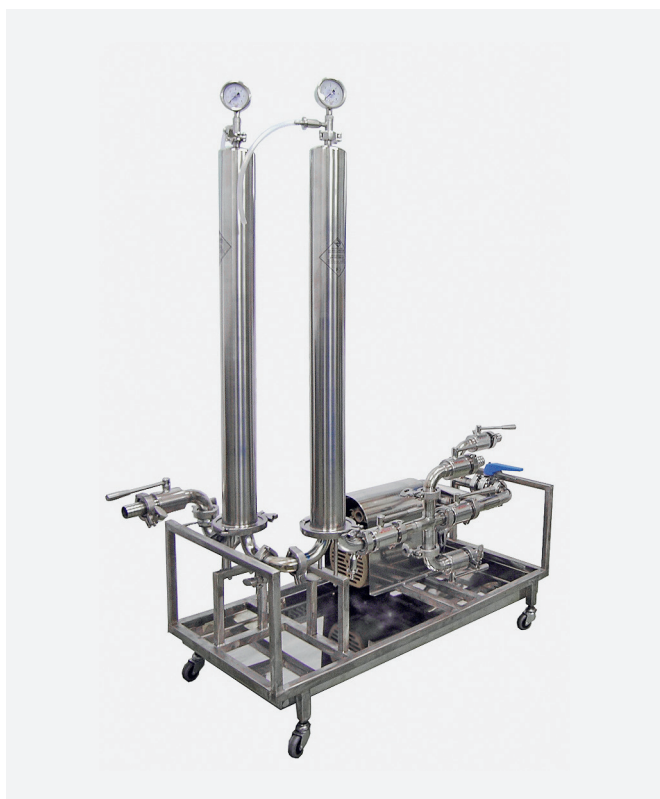
Рис. 8. Фильтрационная установка УФ-2