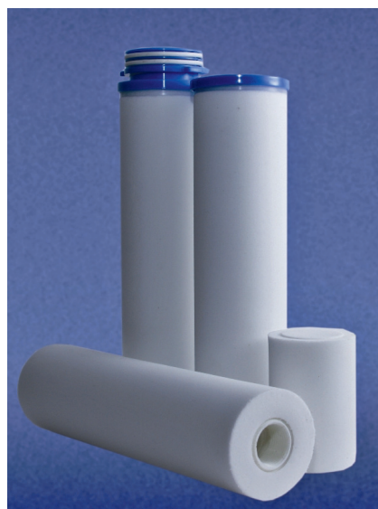
Рис. 3. Фильтрующие элементы на основе «ЭКОПЛАСТ-РЕ»