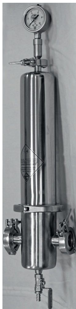
Рис. 5. Фильтродержатель ДФП-201G-250-A7-1