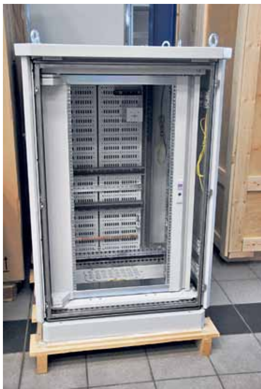
Двухкорпусная конструкция шкафа для наружной установки

Функционал терминала формируется аттестационными требованиями заказчиков (ПАО "Россети", ПАО "Газпром",