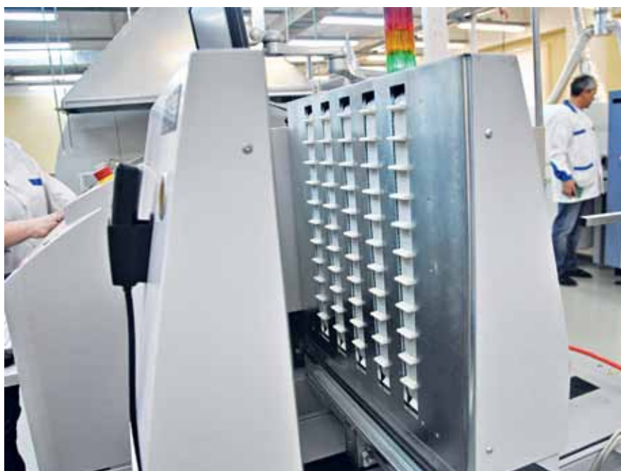
"Интерьер" транспортной системы разбраковщика (слева). Рабочие места ручной пайки (справа)

Хочу отметить, что нашу вторую линию можно считать уникальной. На ней мы едва ли не первыми в России смогли реализовать технологию pin-in-paste, позволяющую монтировать