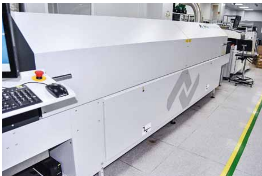
Печь пайки оплавлением Ersa Hotflow 3/14e с семью зонами нагрева и двумя – охлаждения

Пока нет. Но компоненты 0201 в большом количестве применяются в изделии, которое с 2020 года