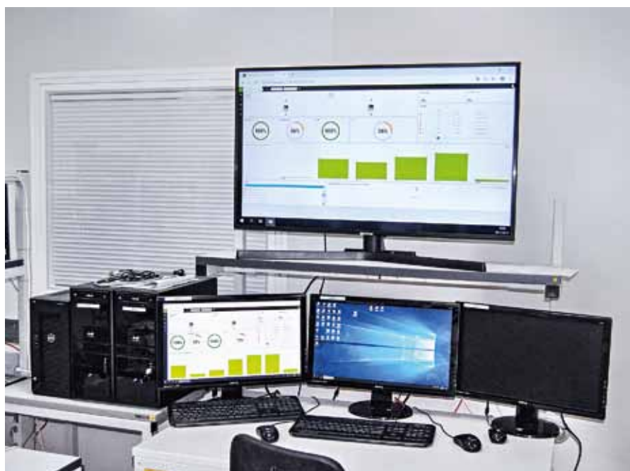
Мониторы системы «Умная линия»

Современное оборудование поставляется с программным обеспечением (ПО), которое, как правило, позволяет собирать и обрабатывать определенную информацию о техпроцессе. Этого ПО недостаточно