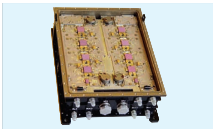
Рис. 1 Сверхширокополосный четырехканальный приемо-передающий модуль L-диапазона

Не менее важно и развитие Центра проектирования. Современные средства проектирования позволяют сократить сроки разработки и ускорить освоение изделий. В последние годы на предприятии заложены основы для формирования и развития необходимых комплексов проектирования полупроводниковых приборов, МИС, СВЧ-модулей и устройств на их основе, а также комплексов разработки технологии, документации и технологической оснастки для изготовления комплексированных изделий, расчета их термодинамических харак-