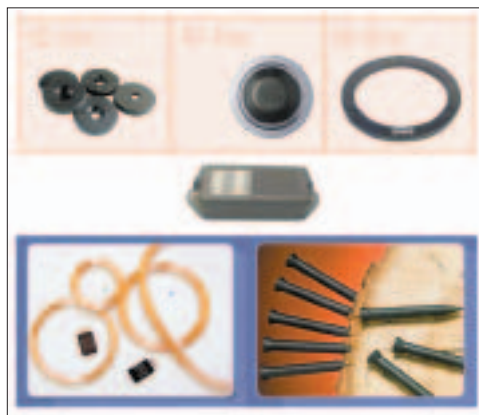
Рис.3. Формы меток RFID-систем

Ф у н к ц и о - нальные возможности чиповых меток значительно шире, чем бесчиповых . Они способны хранить большие объемы информации, но из-за высоких