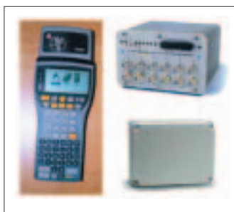
Рис.1. Конструктивные исполнения считывателей RFID

Ридер сканирует метку и считывает хранимую в ней информацию. Его конструктивное исполнение самое разнообразное – от простого переносного сканера до стационарного устройства, сканирующего упаковки по мере их продвижения по конвейеру (рис.1).