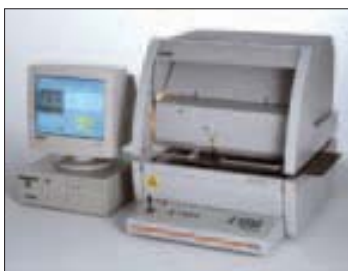
Рис. 1. Измерительный комплекс FISCHERSCOPE X-Ray XDVM-W

Ниболее важная особенность измерительной системы FISCHERSCOPE X-Ray XDVM-W – возможность коррекции параметров первичного спектра путем установки исходного напряжения номиналом в 30, 40 и 50 В. Например, при измерении очень тонкого покрытия, состоящего из однородных химических элементов с низкой энергией возбуждения, требуется первичное рентгеновское излучение небольшой энергии, что обеспечивается исходным напряжением наименьшего номинала. Кроме