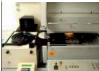
Рис. 2. Модификация измерительного комплекса FISCHERSCOPE X-Ray XDVM-W для измерения толщины покрытий на кремниевых пластинах

Следующее достоинство новой измерительной системы – целевое высокоэффективное программное обеспечение, разработанное в компании наиболее опытными специалистами в области измерений. Преимущество этого программного продукта – WinFTM – особенно проявляются при измерениях сложных тонких систем покрытий на печатных платах. В результирующем измерительном спектре тестируемого покрытия программа автоматически устраняет помеховое воздействие соединений брома, содержащихся в материале подложки. Без каких-либо дополнительных