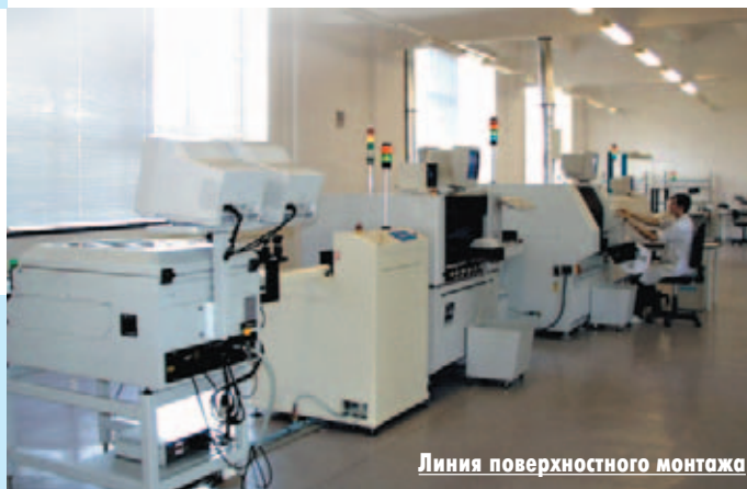
Линия поверхностного монтажа