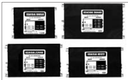
Рис. 2. Встраиваемые AC/DC- и DC/DC- преобразователи