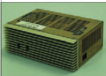
Рис. 3. AC/DC- преобразователь мощностью 100 Вт

С целью совершенствования продукции и расширения номенклатуры стандартных ИП группа КОНТИНЕНТ постоянно проводит внутренние НИОКР. Один из результатов – значительное расширение ряда dc/dc-преобразователей, предназначенных для монтажа на печатную плату. Ожидается появление и ac/dc-преобразователей в данном исполнении, появились модификации ИП с регулируемым выходным напряжением, разработаны различные варианты конструк-