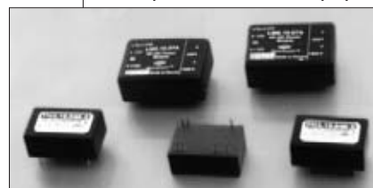
Рис. 1. DC/DC-преобразователи для монтажа на печатную плату

За последние годы рынок ИП сложился и в России. Наряду с другими производителями здесь активно действует группа компаний КОНТИНЕНТ, куда, в частности, входят ОКБ “Титан” и НПФ “Силовая электроника”. Первые ИП с торговой маркой КОНТИНЕНТ появились уже более 10 лет назад. Объем их производства то расширялся, то сокращался – в зависимости от состояния дел в стране и в ее приборостроении. В последние же годы наблюдается устойчивая тенденция к росту объема выпуска ИП, что явно свидетельствует об активизации промышленности. Потребители – самые разные, от крупных государственных предприятий и акционерных обществ до частных лиц. ИП одного и того же типа могут приобретать, например, для связной аппаратуры, устройств промышленной автоматики, систем обеспечения безопасности железнодорожного движения, охранных систем, рекламных установок, оборудования бензозаправочных станций и ТЭЦ, казино и т.д. Развиваются традиционные, появляются доселе не слышанные области применения ИП, и это воодушевляет. Достаточно сказать, что за последний год стандартные и заказные ИП с торговой маркой КОНТИНЕНТ приобрели более 450 предприятий, причем многие обращались неоднократно, а с некоторыми согласованы графи-