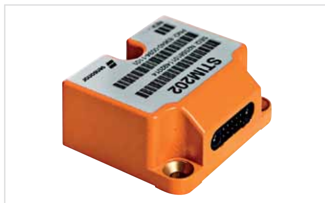
Рис.1. Внешний вид гироскопа STIM202

кристалла кремния. Принцип действия приборов, основанных на технологии Butterfly, такой же, как и у других вибрационных гироскопов. Специальная система возбуждает первичные противофазные колебания инерциальных масс (рис.2). Если происходит поворот гироскопа, то под действием силы Кориолиса инерциальные массы смещаются в направлении, перпендикулярном плоскости первичных колебаний (см. рис.2). В результате возникают вторичные колебания, частота которых совпадает с частотой