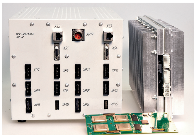
Рис.1. Высокоскоростной многокластерный интегрированный модуль обработки данных

антеннами, систем радиоизмерений и т.д.), могут применяться в системах управления транспортными, авиационно-космическими и энергетическими комплексами. Высокоскоростной многокластерный интегрированный модуль обработки данных состоит из базовой платы (с возможностью установки на нее до пяти субмодулей) и представляет собой моноблок с пассивным воздушным охлаждением, предназначенный для применения в целевом устройстве (ЦУ) – аппаратном комплексе, в составе которого будет эксплуатироваться.