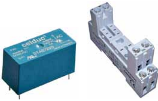
Рис.4. ТТР серии ST и кронштейн для его установки на DIN-рейку

Серия SP-ST – это стандартные реле двух габаритов, сочетающие в себе доступность и широкие возможности по доработке (рис.4). Коммутируемые ток и напряжение серии SP-ST: до 4 А/12...275 В переменного тока и до 5 А/0...68 В постоянного тока; управляющее напряжение: 15...30 В переменного тока или 4...16 В/12...30 В постоянного тока (или сочетание двух вариантов), габариты: 29×12,7×15,7 мм или 29×12,7×25,4 мм.