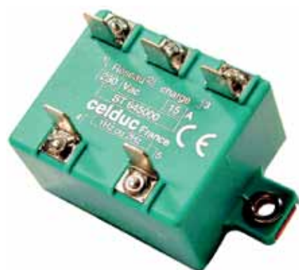
Рис.14. ТТР серии ST6

Серия SU включает в себя реле со вставными соединителями для цепей управления и дополнительно подключаемыми модулями (рис.12). Основные параметры реле серий SU/SUL/SUM: коммутируемые ток и напряжение до 25 А/12...275 В или