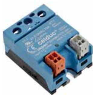
Рис.9. ТТР серии SOR