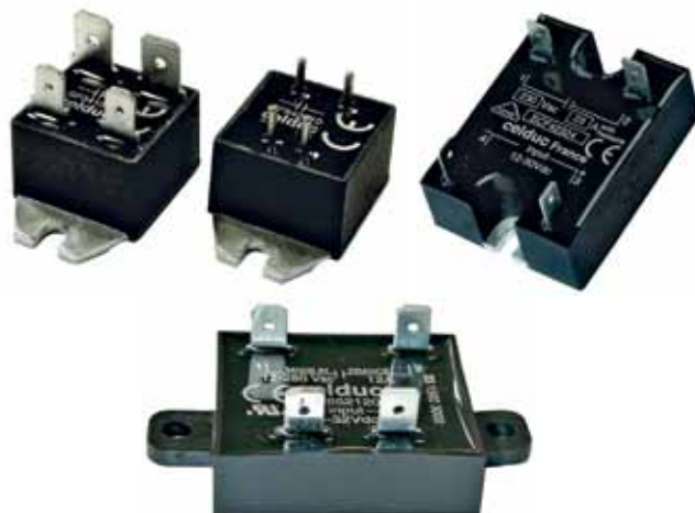
Рис.15. ТТР с плоскими клеммами серий SF, SCF и SP7

Помимо однофазных, практически все линейки реле celduc® relais содержат двух- и трехфазные