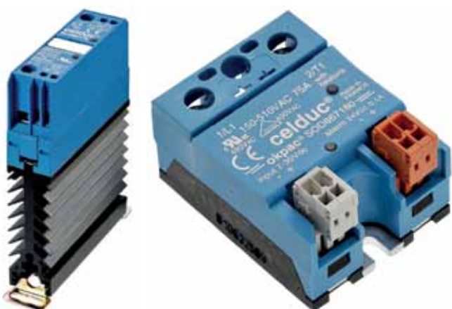
Рис.13. ТТР серий SILD и SOD

обеспечить минимальный занимаемый объем. Реле серий SA/SAL/SAM/SU/SUL/SUM позволяют решать задачи коммутации и развязки в ограниченном пространстве с возможностью монтажа на теплоотводы и прямым подключением дополнительных модулей (например, контроля токов или терморегуляторов ПИД). Также доступны реле с поддержкой функций диагностики серий SILD/SOD.