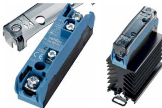
Рис.11. ТТР серий SA и SAM с прозрачными защитными крышками

ТТР серии SOR (рис.9) поставляются со съемными входными соединителями на базе пружинных клемм для большего удобства и безопасности монтажа. Серии SC и SCQ (рис.10) состоят из реле в класси-