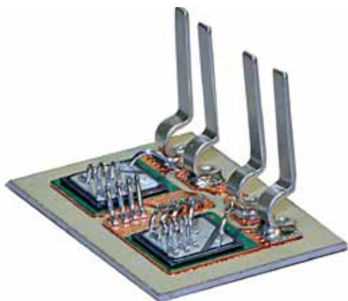
Рис.2. Пример выходного каскада твердотельного реле – тиристор

Компания celduc® relais предлагает одно-, двух- и трехфазные ТТР, которые применяются для управления любыми типами нагрузок. В линейке ТТР представлены устройства, позволяющие реализовать коммутацию практически любого стандартного напряжения с управлением от различных сигналов.