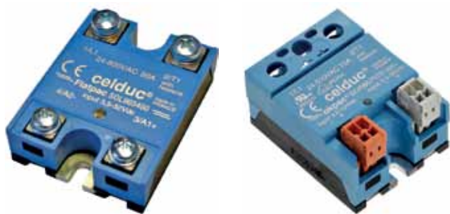
Рис.8. ТТР серии SOL