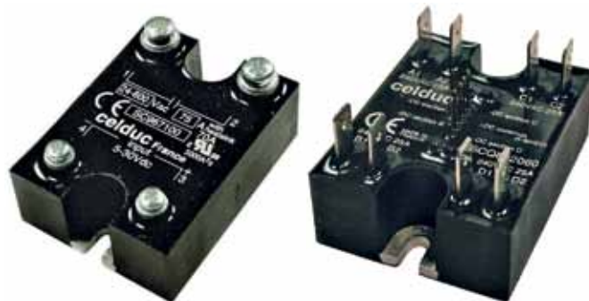
Рис.10. ТТР серий SC и SCQ

пенью защиты IP20 (без возможности касания токопроводящих узлов), обеспечивают простой монтаж проводов посредством винтовых терминалов. Основные характеристики реле серий S07/S08/S09: коммутируемые ток и напряжение до 125 А/24...690 В переменного тока; управляющее напряжение 3...32 В постоянного тока или 20...265 В переменного тока, либо сочетание этих вариантов; габариты 45×58,5×30 мм.