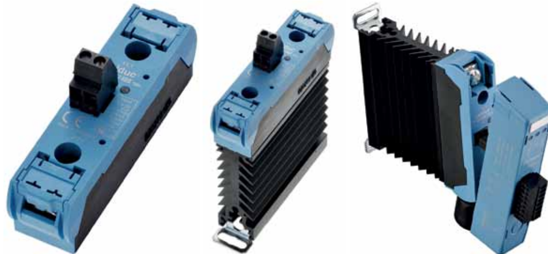
Рис.12. ТТР серий SU, SUL и дополнительный модуль ECOM

Линейка celpac® представлена современными мощными твердотельными реле габаритами 2G для применения в приложениях, в которых важно