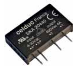
Рис.6. ТТР серии SKA для пайки на печатную плату

Линейки реле SKA/SKB/SKH/SN8/SHT, включающие в себя устройства для монтажа на печатные платы (рис.6), позволяют разработчику, в зависимости от решаемой задачи, быстро подобрать нужный вариант: