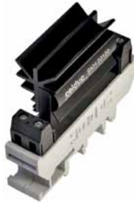
Рис.5. ТТР серии ХК с радиатором, установленное в кронштейн для монтажа на DIN-рейку

ТТР для цепей управления серии ХК специально разработаны для таких нагрузок, как сопротивления, индикаторы, электромагнитные катушки, электродвигатели, контакторы (рис.5). Устройства оснащены встроенным светодиодным индикатором. Коммутируемые ток и напряжение реле серии ХК: до 10 А/12...280 В или до 5 А/440 В переменного тока и 1 А/2...220 В, или до 3 А/2...60 В, или до 10 А/12...36 В постоянного тока. Управляющее напряжение реле составляет 15...30 В или 150...240 В переменного тока, или 6...30 В/15...30 В/10...32 В/90...240 В постоянного тока (либо сочетание двух вариантов), их габариты 12,2×76,4×53 мм, 17,2×76,4×53 мм или 25×76,4×65 мм.