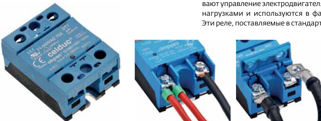
Рис.7. ТТР серии S07 и варианты подключения

Разработанные для большинства стандартных применений реле серий S07/S08/S09 (рис.7) обеспечивают управление электродвигателями, индуктивными нагрузками и используются в фазовых регуляторах. Эти реле, поставляемые в стандартных корпусах со сте-