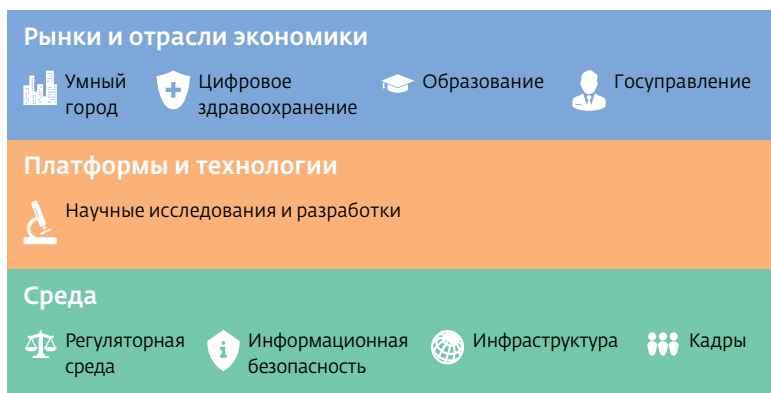
Рис.1. Уровни и приоритетные направления программы "Цифровая экономика Российской Федерации"

В рамках программы цифровой экономики выделены следующие направления (см. рис.1):