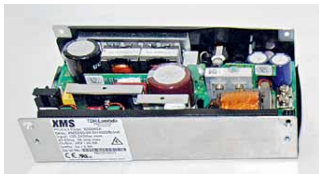
AC-DC преобразователь серии XMS

В серии присутствуют модели с выходной мощностью 15, 30 и 60 Вт и напряжением 5, 9, 12, 15 и 24 В. Отмечу, что в серии-предшественнице наибольшая выходная мощность составляла 40 Вт. КПД серии достигает 89%, а потребление в режиме холостого хода – менее 0,1 Вт для модели KMS15A, менее 0,15 Вт для KMS30A и менее 0,3 Вт для KMS60A. Диапазон рабочих температур составляет -40...+85\text{ }^{\circ}\text{C} со снижением выходной мощности при