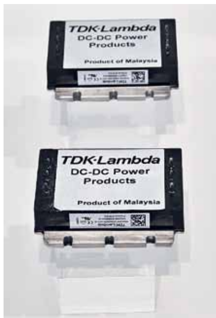
DC-DC преобразователи для промышленного применения серии HQA с фланцевым основанием

Так, модель CUS350M-24/F при вынужденном охлаждении обладает максимальной выходной мощностью 420 Вт.