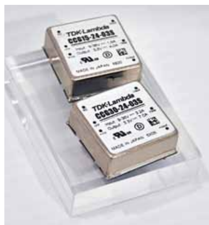
DC-DC преобразователи серии CCG

Среди DC-DC преобразователей, представленных на нашем стенде, – промышленная серия HQA. Эти модули выполнены в защищенном исполнении, что позволяет применять их в жестких условиях эксплуатации. Диапазон их рабочих температур составляет -40...+115 °С, а некоторые модели поставляются также с более жестким