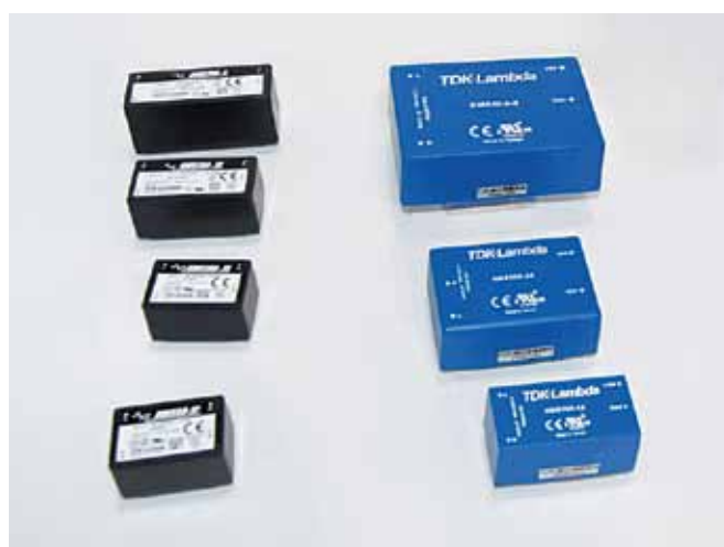
Модули серий KWS-A (слева) и KMS-A (справа)

Серия KWS-A обладает высоким КПД. Например, модель KWS25A-24 при входном напряжении 200 В обладает КПД 88%. Потребление в режиме холостого хода для данной серии не превышает 0,5 Вт. Модули выпускаются