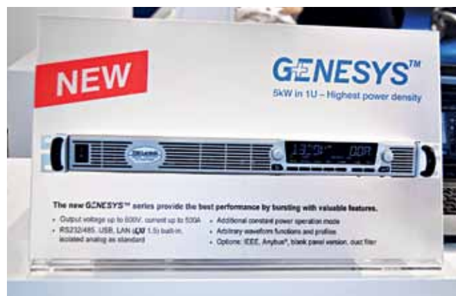
Программируемый источник питания GENESYS+

К PoL-преобразователям также относятся модули iCF, iCG, iBF и iAF с максимальными выходными токами 3, 6, 12 и 20 А соответственно. Каждый из этих четырех преобразователей выпускается в двух исполнениях – с диапазонами входных напряжений 2,4...5,5 и 4,5...14 В и регулируемым выходным напряжением в диапазонах 0,6...3,63 и 0,7...5,5 В соответственно.