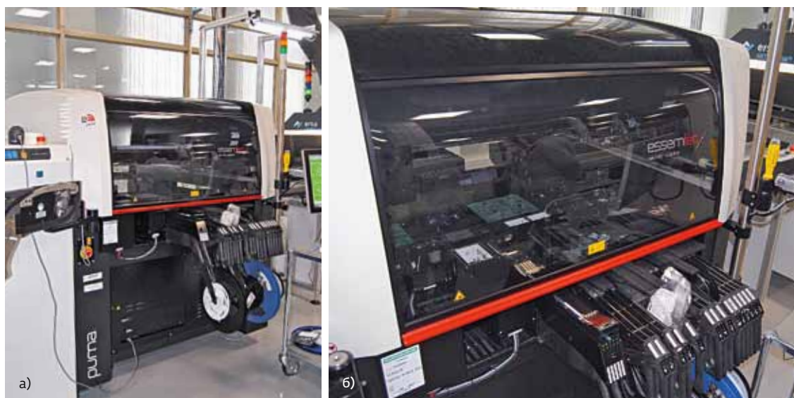
Универсальный сборочный центр Essemtec Puma: а – общий вид; б – рабочая зона и питатели

Производительность процесса дозирования, действительно, сравнительно невелика: две монтажные головы автомата с двумя инструментами каждая обеспечивают практическую скорость установки 11 тыс. комп. / ч, а дозатор – порядка 8 тыс. доз в час. Мы используем шнековый дозатор – каплеструйный работает быстрее, но у шнекового лучше точность. Сегодня мы устанавливаем компоненты типоразмера 0402, и это не предел возможностей дозатора. Этим, кстати, объясняется и сравнительно большая длительность процесса дозирования: насадка, способная работать с компонентами 0201, при необходимости заполнения больших контактных площадок, а тем более полигонов, должна