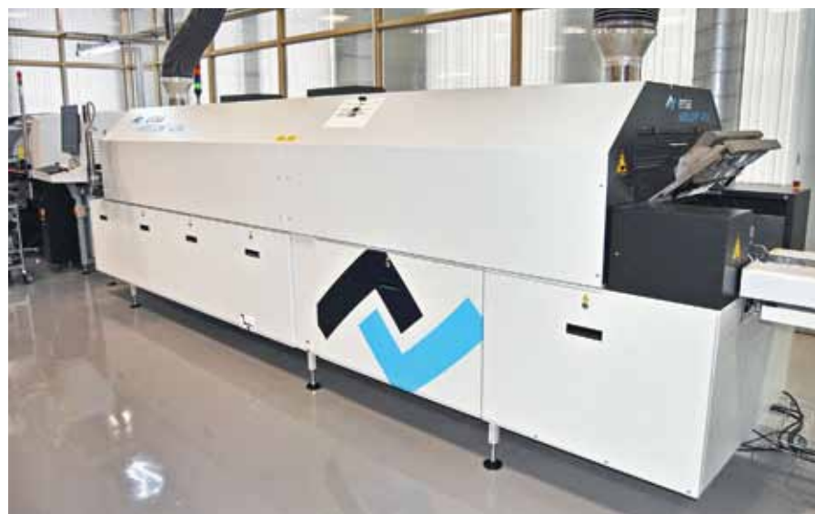
Конвекционная печь ERSA Hotflow 4/14

Маршрут движения дозатора Essemtec Puma строит автоматически. При желании можно запрограммировать свой вариант, однако практика показывает, что маршрут, формируемый автоматом, оптимален.