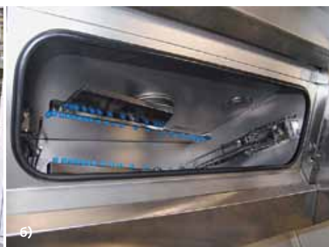
Модуль струйной отмывки miniSWASH компании PBT Works (Чехия): а – общий вид; б – рабочая зона