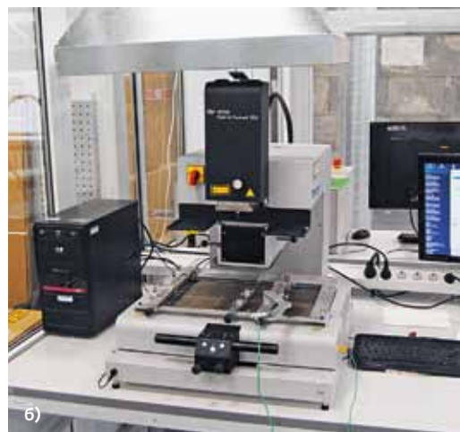
Участок ручного монтажа: а – рабочие места; б – ремонтный центр HR550 компании ERSA