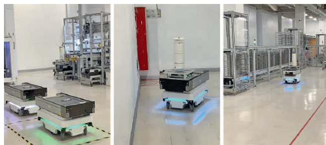
Рис. 6. Автоматические управляемые тележки

Денис Подольский: Очевидно, что вместе с увеличением нагрузки на склад, связанным с ростом объемов производства и расширением номенклатуры, также возрастают и требования к системе хранения и учета паяльных