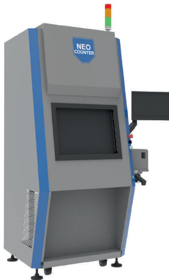
Рис. 4. Система NEO COUNTER

Система SMD BOX повышает производительность и эффективность, связывая производство и материальный