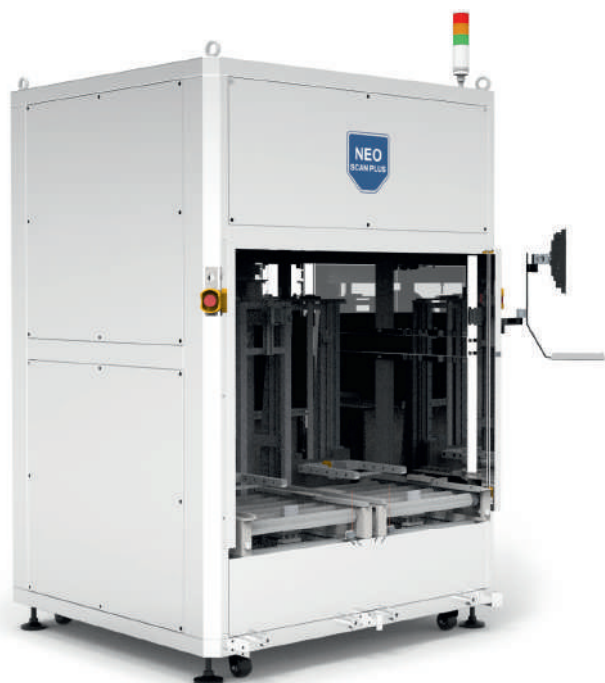
Рис. 3. Система NEO SCAN PLUS

компонентов с использованием технологии рентгеновской визуализации, которая создана для предоставления мгновенной и точной информации о количестве компонентов.