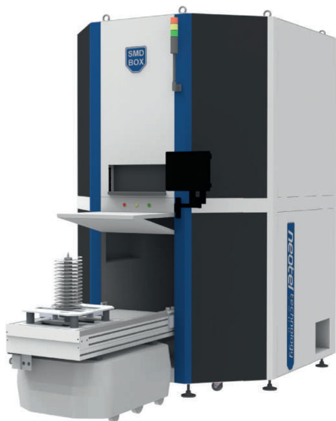
Рис. 5. Система SMD BOX MIMO

поток с помощью технологии SMF (Smart Material Flow, умный поток материалов). Это обеспечивает бесшовную интеграцию с вашей производственной линией и оптимизирует поток материалов, что приводит к повышению общей производительности.