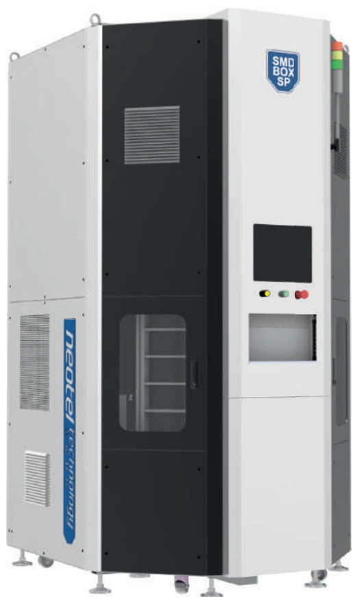
Рис. 8. Система SMD BOX SP

Ван И: Так и есть, Антон. Только автоматизированный склад может быть эффективным инструментом, который позволит предприятию перейти к управлению запасами и закупкам в концепции бережливого производства. Такой инструмент обеспечивает своевременную и безошибочную поставку необходимых комплектующих точно в срок и предоставляет всю необходимую для принятия решений информацию. ●