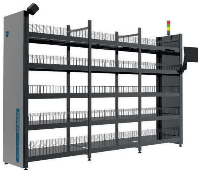
Рис. 7. Система NEO LIGHT

Ван И: Первый и самый главный принцип склада – адресное хранение. Все автоматизированные места хранения