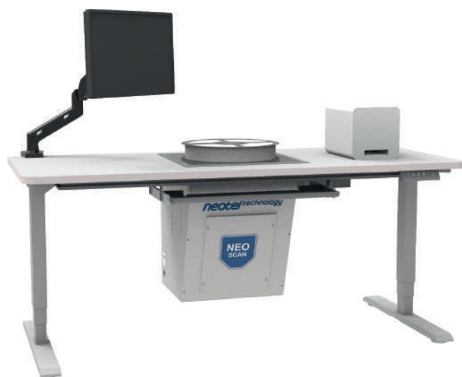
Рис. 2. Система NEO SCAN

Денис Подольский: Штрихкодирование – это нанесение на упаковку с материалом или компонентами числового кода (метки штрихкода), который можно считывать с помощью сканера. Штрихкод составляется по разным стандартам, он может содержать определенную запись системы, служащую для однозначной идентификации промаркированного объекта.