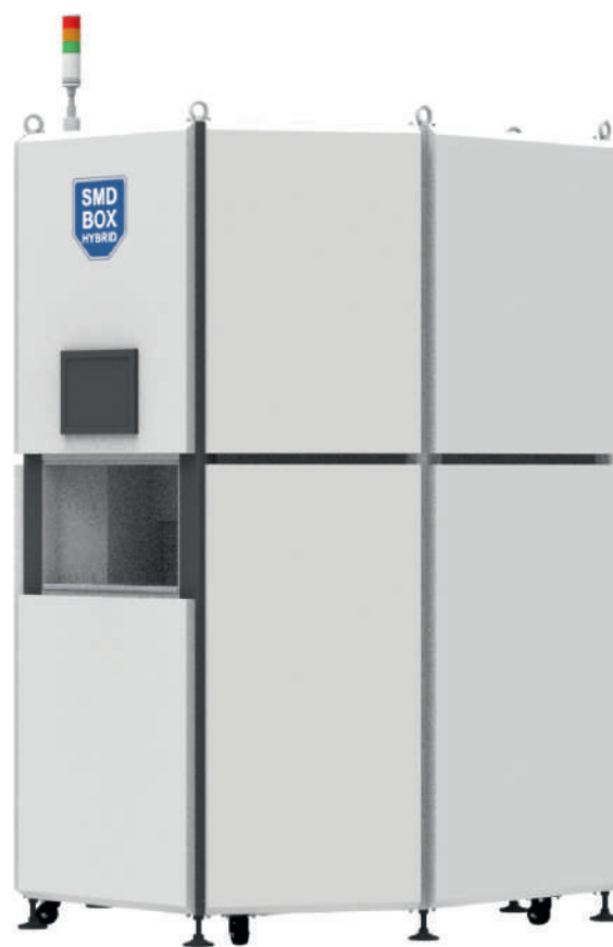
Рис. 9. Система SMD BOX HYBRID