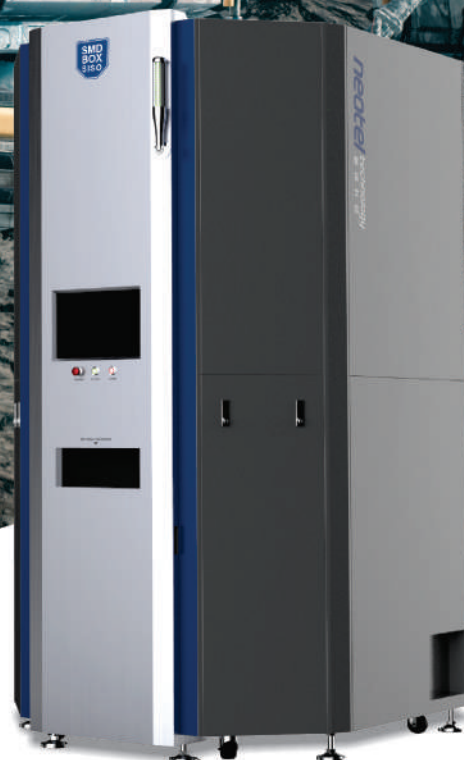
Интеллектуальная система хранения компонентов Neotel SMD BOX SIS0